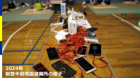
2024年 能登半島地震避難所の様子