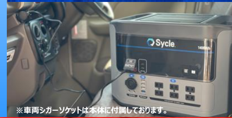
※車両シガーソケットは本体に付属しております。